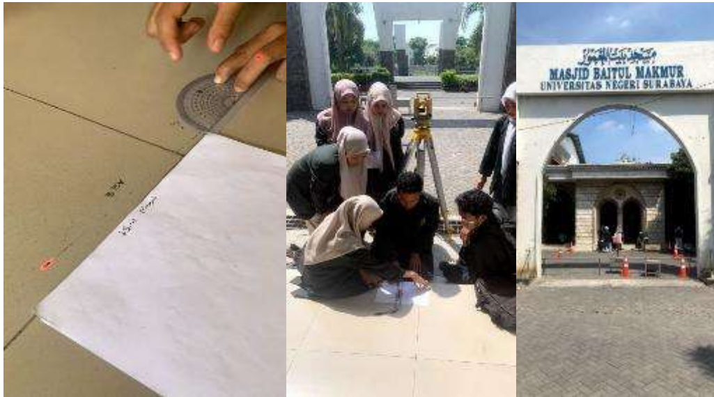
Gambar 5. Tanda arah kiblat masjid Baitul Makmur UNESA

Berdasarkan perhitungan dan pengukuran pada masjid Baitul Makmur UNESA diketahui terdapat deviasi (kemelencengan) kurang 5^\circ ke arah Utara, deviasi tersebut sudah melebihi batas deviasi yang masih ditoleransi oleh syar'i seperti yang sudah disampaikan oleh Zainul Arifin melalui penelitiannya. Ini berarti bahwa ketika rentang nilai sudut dari Indonesia adalah 291^\circ - 295^\circ , dan jika deviasi arah kiblat melebihi 3^\circ , maka arah yang dituju tidak lagi mengarah ke Arab Saudi atau bahkan ke arah Ka'bah melainkan ke arah lainnya diluar Saudi Arabia. Dengan jarak Semarang-Ka'bah sekitar 8.300 km, penyimpangan 5^\circ setara dengan pergeseran lateral sekitar 725 km dari posisi Ka'bah. Artinya, secara geodesis, arah shaf salat di masjid tersebut tidak lagi mengarah ke wilayah Arab Saudi.