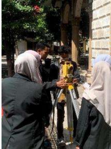
Gambar 1. Proses pemasangan theodolite yang presisi

yang harus dilakukan adalah memasang Theodolite diatas tripod dan pastikan Theodolite benar-benar datar dengan melakukan leveling pada ketiga sisi bagian tripodnya. Jika sudah presisi pada ketiga sisinya maka secara otomatis gelembung nivo bulat berada ditengah bulatannya. Hal ini sangat penting, karena apabila tidak tegak lurus maka akan menghasilkan informasi yang salah.