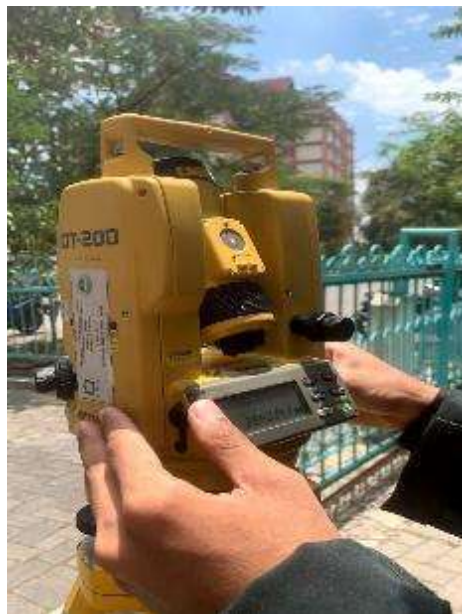
Gambar 2. Proses mengunci theodolite dengan sekrup horizontal clamp

Setelah Theodolite terpasang dengan benar, maka selanjutnya membidik matahari. Setelah matahari berhasil dibidik, buka aplikasi stellarium lalu perhatikan jam dan nilai azimut matahari pada saat objek berhasil di bidik. Setelah itu kunci Theodolite dengan sekrup horizontal clamp dan dikencangkan agar tidak bergerak. Selanjutnya tekan tombol "0-Set" pada Theodolite , agar angka pada layar HA ( Horizontal Angle ) menunjukkan angka nol.