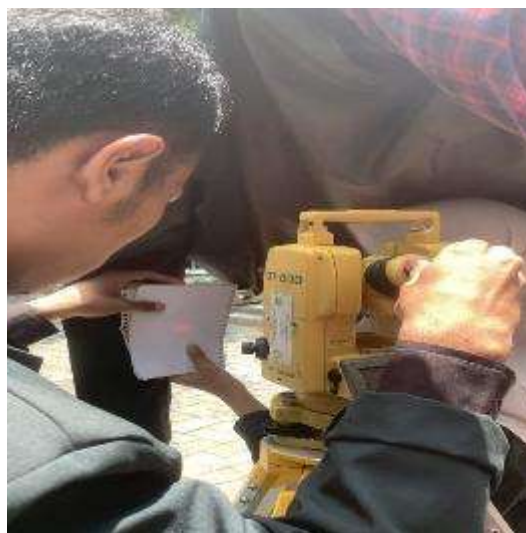
Gambar 4. Proses membidik untuk menentukan Titik Y dan Z

Tahapan selanjutnya adalah memberi tanda arah kiblat masjid Baitul Makmur UNESA. Nyalakan laser dan turunkan bidikan Theodolite sampai menyentuh lantai pada jarak sekitar 5 meter dari Theodolite . Kemudian berilah 2 titik misalnya titik Y dan Z, dengan jarak 20 cm antara kedua titik. Hubungkan antara titik Y dan titik Z menggunakan spidol sehingga membentuk garis lurus. Garis itulah arah kiblat masjid Baitul Makmur UNESA.