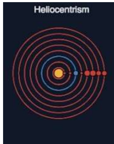
Gambar 2 Heliocentric theory illustration