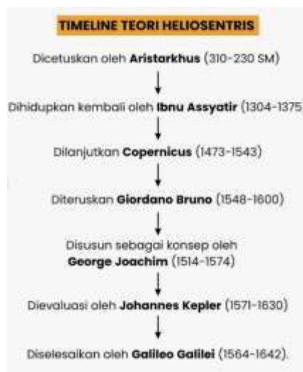
Gambar 3 time line teori heliosentris

Di tengah zaman mengalami zaman dark age yaitu zaman kegelapan di mana saat itu barat mengalami kemunduran dalam ilmu pengetahuan, namun hal tersebut berbanding terbalik dengan zaman Islam di mana saat itu ilmu pengetahuan berkembang pesat dan para ilmuwan sangat di hargai, Jauh sebelum Copernicus yang dikenal luas sebagai pencetus teori heliosentris, Ibn al-Shatir sebenarnya telah menemukan konsep awal dari teori ini (Halimah, 2018). Gagasan tersebut kemudian diadopsi dan dikembangkan lebih lanjut oleh Copernicus. Dalam anime Orb: On the Movements of the Earth juga disebutkan sosok Albert Brudzewski yang menjadi tokoh utama terakhir yang menjadi representasi dari tokoh nyata, yang kemudian akan menjadi pengajar di universitas, yang akan bertemu dengan Nicolas Copernicus dan mengajarkan tentang Teori Heliosentris kepadanya. Inilah yang kemudian akan menjadi salah satu pemicu penting dalam penelitiannya mengenai teori heliosentris.